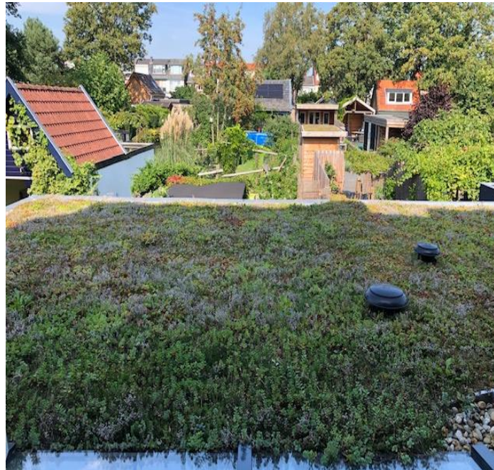
Foto's van ons eigen dak. Links maart 2020, rechts sept 2020.